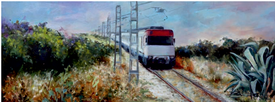
Electrificación. Óleo / lienzo. 27 x 73 cm.