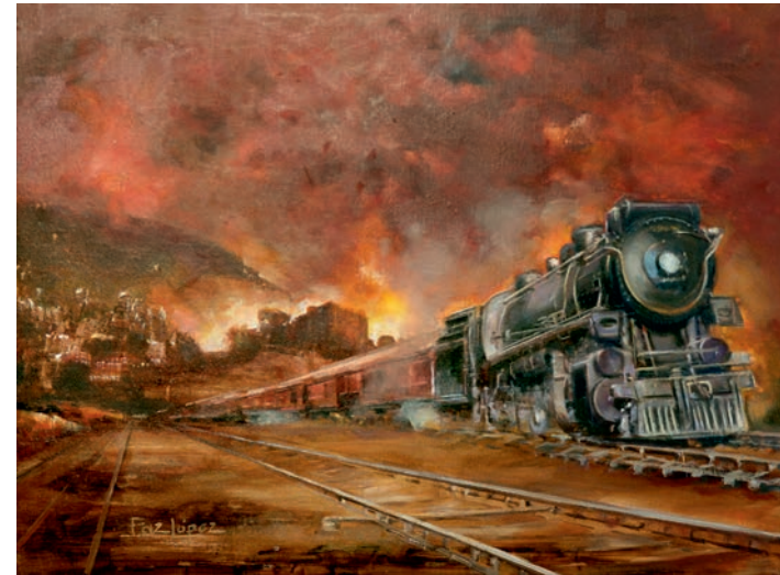
Detrás, la ciudad. Óleo / lienzo. 46 x 61 cm.

Su atracción por el ferrocarril comenzó de niña, cuando, como ella misma rememora, eligió el tren para uno de sus primeros trabajos escolares. La llegada del AVE a Málaga en 2007, supuso el revulsivo que le motivó a realizar una colección de obras con un único tema, el ferrocarril, abarcando en la temática desde sus orígenes con las primeras locomotoras de vapor, hasta el tren de Alta Velocidad.