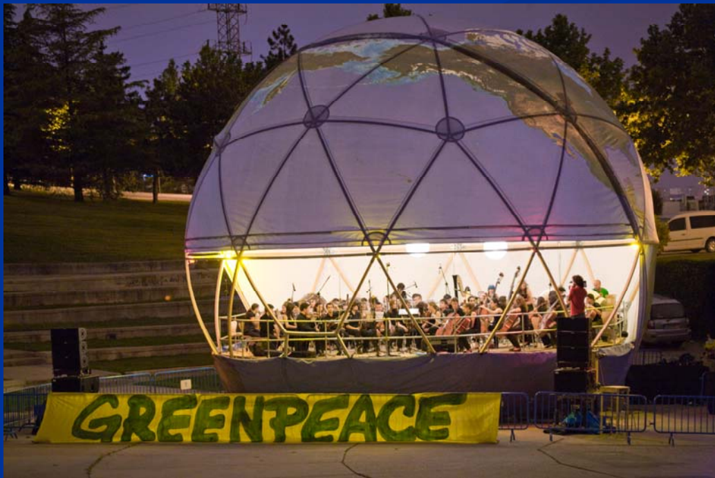
“Concierto por el Clima”. Auditorio Parque Tierno Galván. 8 de mayo de 2009.