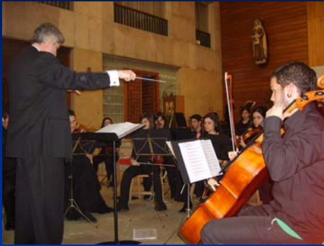
Concierto benéfico. Iglesia Cristo de la Esperanza. Madrid. Diciembre de 2006.

Los alumnos del Conservatorio demuestran una especial sensibilidad hacia los más necesitados y colaboran de forma entusiasta en recitales benéficos.