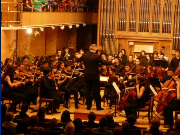
Conservatorio Superior de Música de Madrid. 19 de febrero de 2010.