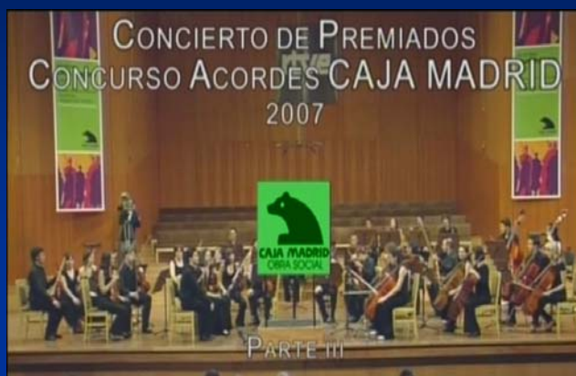
“Los conciertos de La 2”. Noviembre de 2007.