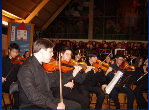
Concierto benéfico. Iglesia Santa M a del Cervellón. Madrid. Diciembre de 2006.

- Han tocado en diversos escenarios de toda España: Auditorio Conservatorio de Getafe, Auditorio de Arroyomolinos, Teatro Cervantes de Campo de Criptana, Auditorio del Conservatorio Superior de Música de Madrid, Teatro Auditorio de San Lorenzo de El Escorial, entre otros.