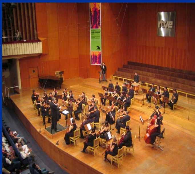
Teatro Monumental. Madrid. 6 de julio de 2007.