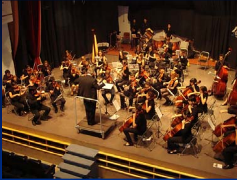
Teatro Cervantes. Campo de Criptana. 6 de junio de 2009.