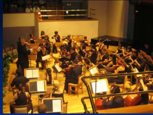
Auditorio Nacional. Sala Cámara. 9 d junio de 2007.