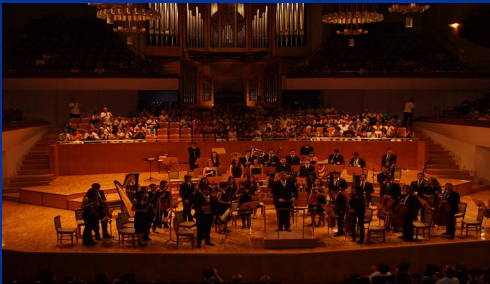
Auditorio Nacional. Sala Sinfónica. 28 de junio de 2008.

- También, han tocado en el Teatro Monumental de Madrid y en numerosas ocasiones en el Auditorio Nacional de Música de Madrid, tanto en su Sala de Cámara como en la Sinfónica.