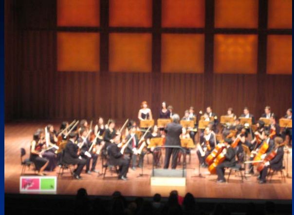
Final Acordes Cajamadrid 2008. Teatro Auditorio San Lorenzo de El Escorial. 19 de abril de 2008.