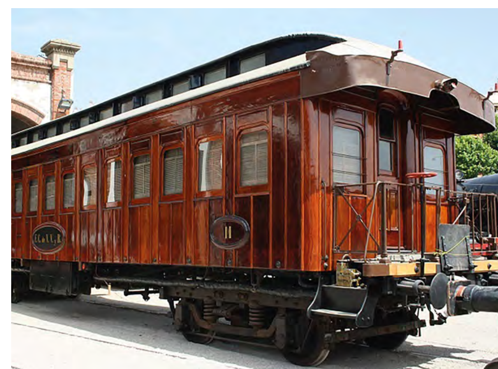
Coche de 2ª clase BB-2597