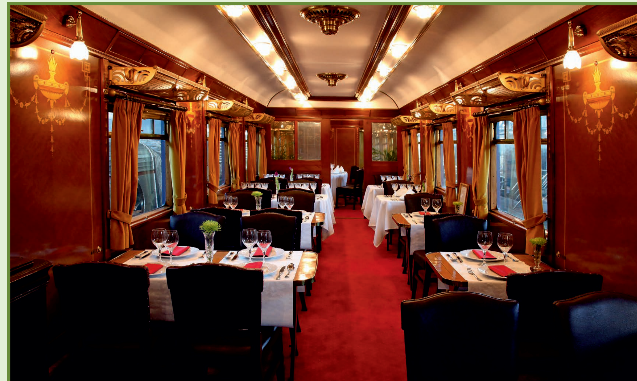
Exhibit IG 2202

Finally, RENFE gave the entire R12-12000 subseries to the Railway Museum in the late nineties, being used for special and tourist services. This car, decorated inside with marquetry featuring ram heads and censers with wreaths, is also suitable for holding meetings or conferences since its tables can be folded and its chairs moved.