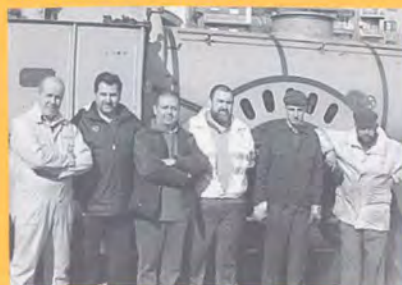
El grupo de maquinistas colaboradores habituales del

museo pasó durante el mes de junio los cursos de formación para la autorización de la máquina 7.600 y 308. A estas autorizaciones se suman las de vapor del mes de abril, con lo que se consolida un grupo de maquinistas de Cercanías de RENFE autorizados a circular con vehículos históricos.