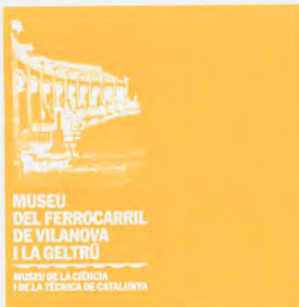
MUSEU DEL FERROCARRIL DE VILANOVA I LA GELTRÚ MUSEU DE LA CIÈNCIA I DE LA TÈCNICA DE CATALUNYA

Vilanova i la Geltrú está situada a 45 km. de Barcelona y a 45 km. de Tarragona