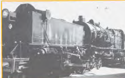
Locomotora 462F-0401 GARRAT (Ferrocarril Central de Aragón 101), 1931

La Garrat es una de las locomotoras de vapor más singulares del mundo y especialmente emblemática dentro de la colección del Museo. Peculiar por su tecnología y dimensiones, esta locomotora articulada fue creada para incrementar la potencia de las locomotoras convencionales. Con el objetivo de aumentar su rendimiento, permitiendo su inscripción en curva y sin dañar la vía, fue diseñada con una única caldera unida en sus extremos a dos estructuras que disponían de sus rodajes y depósitos de agua y carbón. Es, por lo tanto, una locomotora doble que reparte su peso y mejoraba sensiblemente las