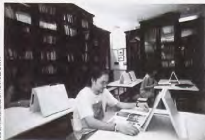
LA HORA DEL CABAL

El Museo del Ferrocarril de Vilanova i la Geltrú ha puesto de nuevo en funcionamiento la biblioteca-hemeroteca, con su valioso fondo documental incrementado. Como informábamos en ediciones anteriores de este boletín, en los primeros días del año 2001, la Gerencia de Mantenimiento e Infraestructura