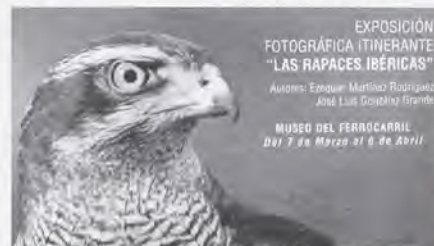
EXPOSICIÓN FOTOGRAFICA ITINERANTE "LAS RAPACES IBÉRICAS" AUTORES: Ezequiel Martínez Rodríguez José Luis González Grande MUSEO DEL FERROCARRIL Del 7 de Marzo al 6 de Abril

La Muestra se ha visto enriquecida notablemente con la presencia in vivo y exhibición- miércoles y domingos de aves rapaces de todas las variedades, cedidas por "LA HALCONERA", Entidad situada en Arganda del Rey y especializada en todas aquellas actividades relacionadas con el apasionante mundo de estas especies.