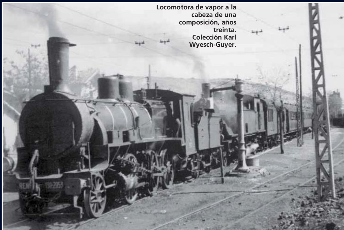
Locomotora de vapor a la cabeza de una composición, años treinta.