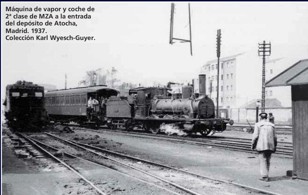
Máquina de vapor y coche de 2ª clase de MZA a la entrada del depósito de Atocha, Madrid. 1937.