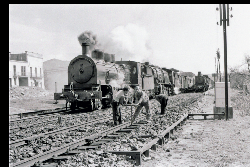
Mantenimiento de la vía en Cervera (1959)

Su interés por el ferrocarril nació en la infancia, influido por el entorno ferroviario de Stans y por sus viajes en el Sud Express a España. Durante su etapa escolar entró en contacto con otros aficionados y con el fotógrafo Hans Ulrich Würsten, iniciando en 1947 una labor de documentación gráfica que mantendría toda su vida. Recorrió extensamente Suiza y fotografió prácticamente todas las compañías ferroviarias del país, con especial atención al material rodante y a la vida cotidiana de la explotación ferroviaria.