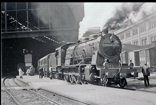
Locomotora 'Mastodonte' en Barcelona-Término (1952)

En las décadas centrales del siglo XX, mientras gran parte de Europa abandonaba la tracción vapor, España se convirtió en un destino privilegiado para los aficionados ferroviarios europeos. Entre ellos se encontraba Karl Wyrsh, quien en las décadas de 1950 y 1960 recorrió el país atraído tanto por sus vínculos familiares como por el singular panorama ferroviario español de la época.