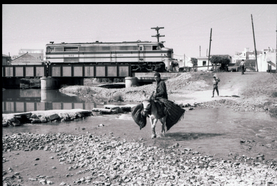
Locomotora diésel 1602 en Algeciras (1960)

Sus fotografías documentan locomotoras, líneas y estaciones hoy desaparecidas, pero también la vida cotidiana del ferrocarril: trabajadores, viajeros y paisajes rurales en una época de transición, cuando la tracción vapor convivía con las nuevas formas de explotación ferroviaria. Wyrsh centró especialmente su atención en la red de ancho ibérico de Renfe —que definía como un «museo vivo»—, así como en líneas de vía estrecha, tranvías y explotaciones secundarias, dejando un valioso testimonio del ferrocarril español de los años cincuenta y sesenta desde la mirada de un ferroviario suizo.