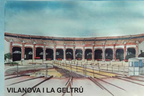
VILANOVA I LA GELTRÚ

UN PASEO POR ESTACIONES DE FERROCARRIL ESPAÑOLAS QUE SE ENCUENTRAN EN USO, REUSO O, LAMENTABLEMENTE, ABANDONADAS.