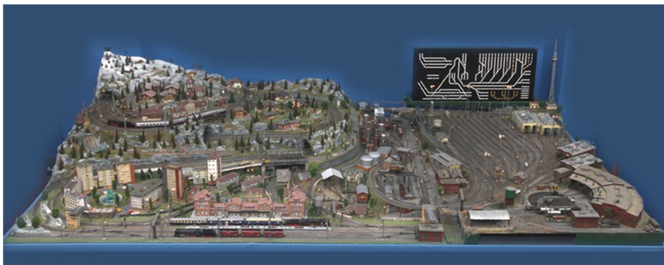
Pieza IG: 05650